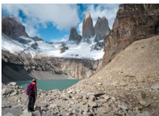
Parc National de Torres del Paine