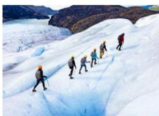
Parc National de Torres del Paine 📍