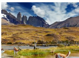
Puerto Natales 📍