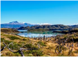
Parc National de Torres del Paine