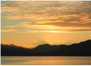
Golfe de Corcovado