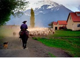
El Calafate 📍