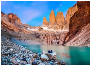
Complexe de Las Torres