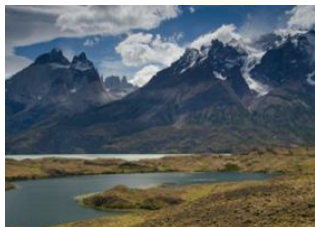
Lac Nordenskjöld 📍