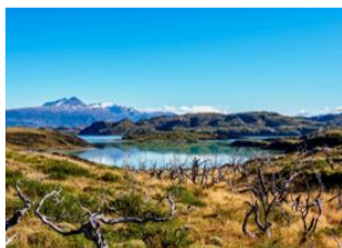
Parc National de Torres del Paine 📍