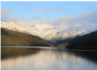
Golfe des Peines 📍