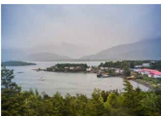
Puerto Eden 📍