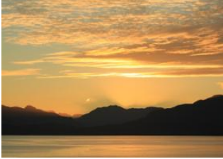
Golfe de Corcovado 📍